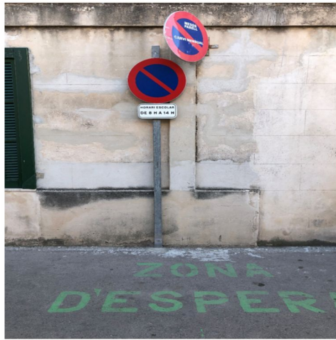
Annex 3, tram no il·luminat primera línia Port de Pollença