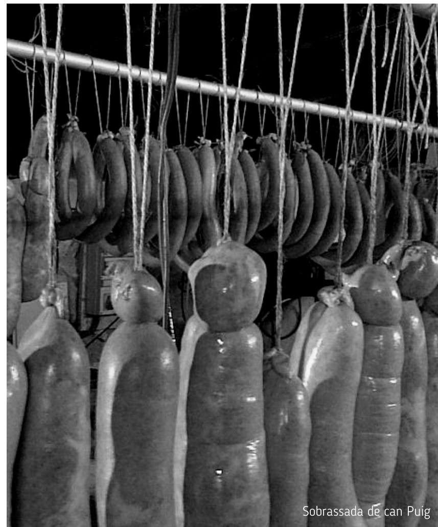
Sobrassada de can Puig