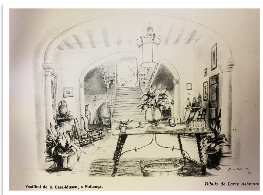
Vestíbul de la Casa-Museu, a Pollença.

La casa primigènia era molt més gran que l'actual, n'hi ha prou en observar la volada, incloïa també les dues cases adjuntes tant la de mà dreta com la de mà esquerra que fa cantonada amb el carrer de l'Ecònom Cifre.